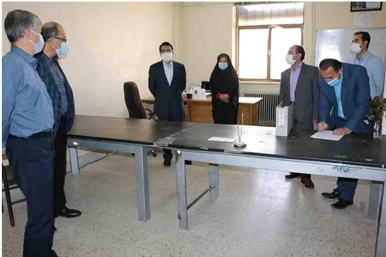
گزارش تصویری بازدید کارگروه نظارت، ارزیابی و تضمین کیفیت دانشگاه جامع علمی - کاربردی استان چهارمحال و بختیاری از حوزه ستادی دانشگاه جامع علمی - کاربردی استان (بازدید از دفتر برنامه ریزی و تدوین رشته ها و بررسی سامانه گسترش و نحوه ایجاد دوره در کمیته هماهنگی استان) 1401/01/28